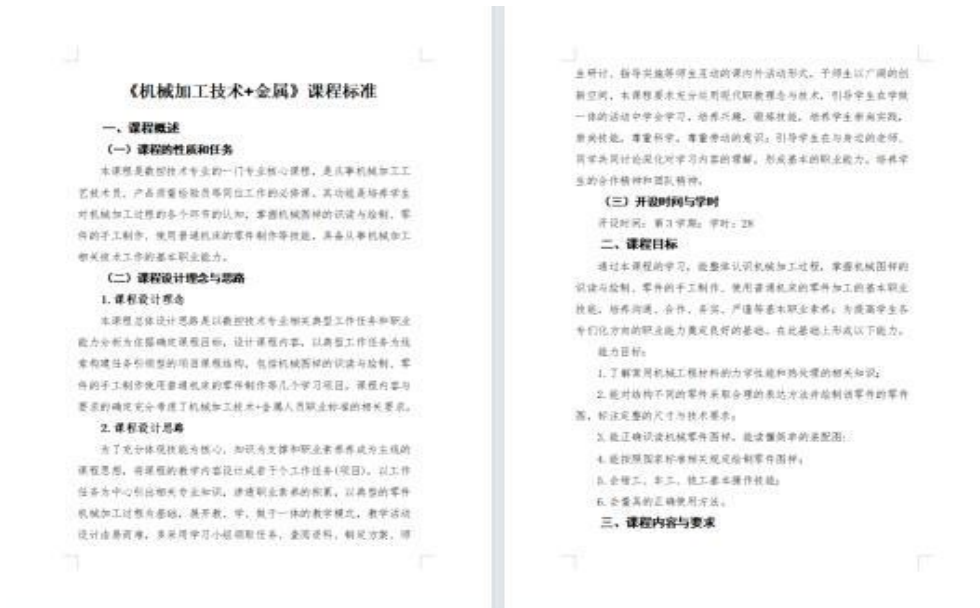
图 5 课程标准部分截图