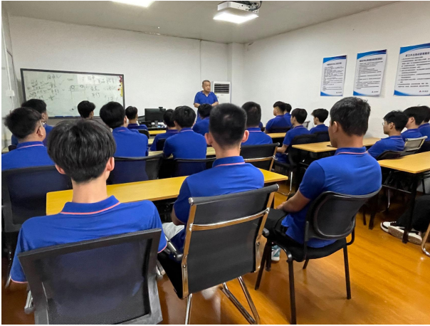
图 1 企业教师上课