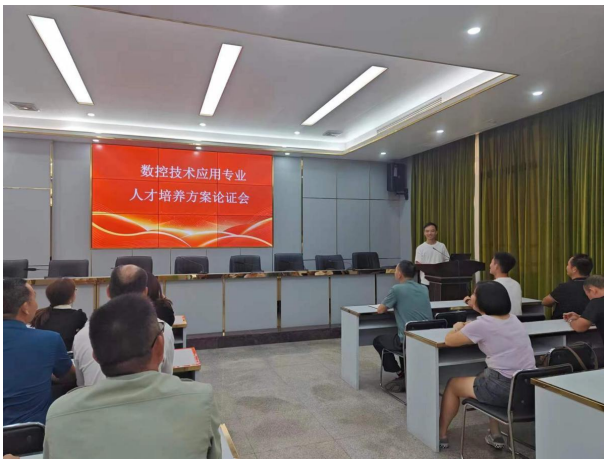
图 3 人才培养方案论证会