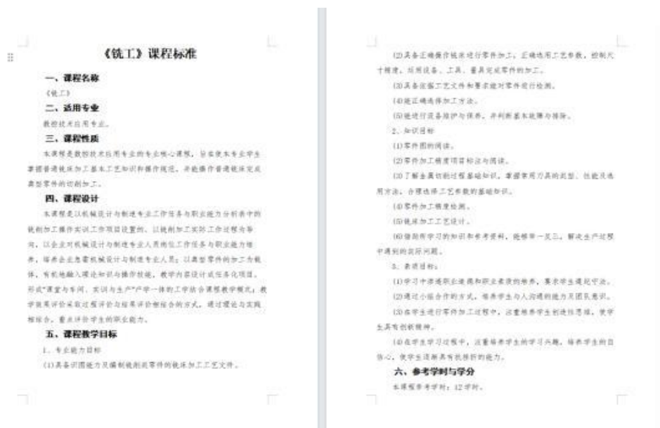
图 6 课程标准部分截图