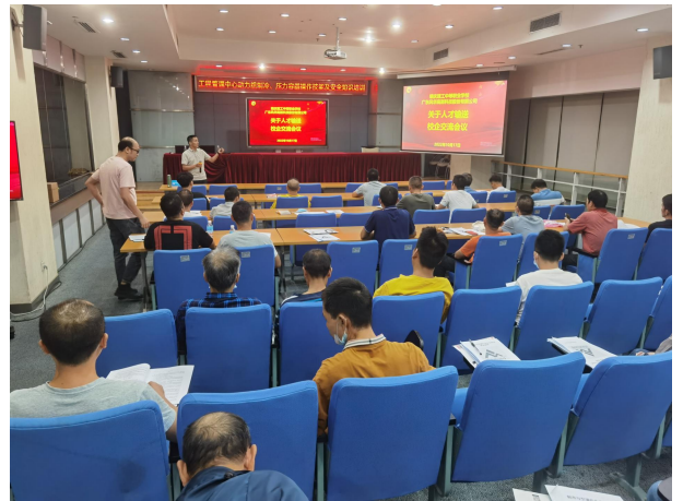
图 4 人才培养企业调研