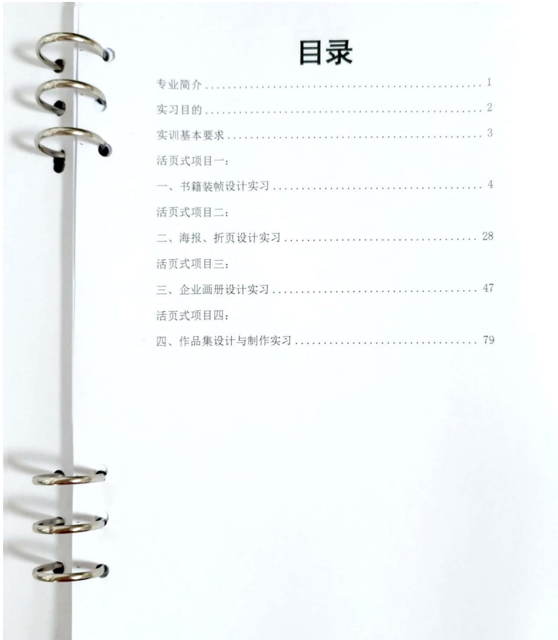
图 2 目录