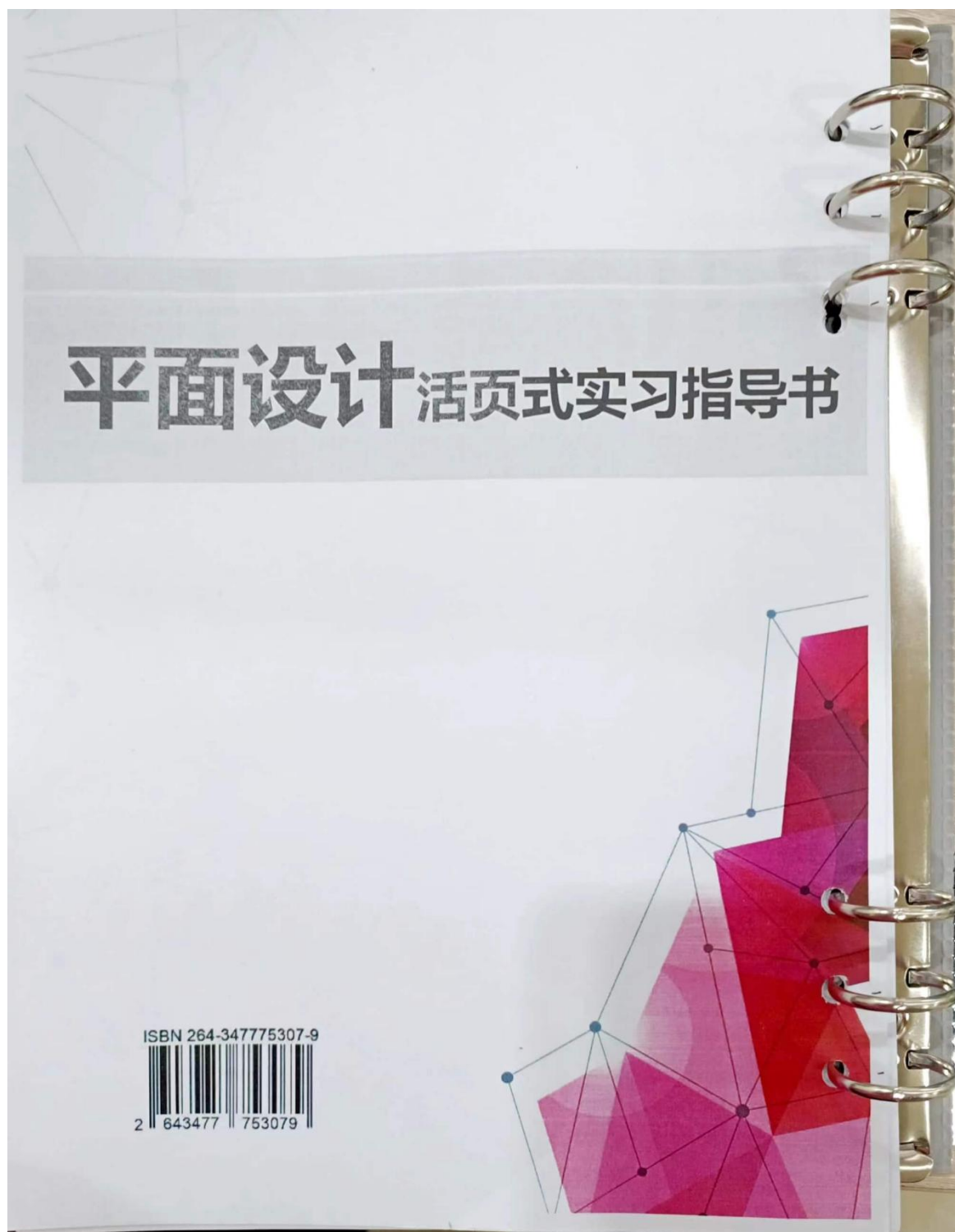
图 4 封底