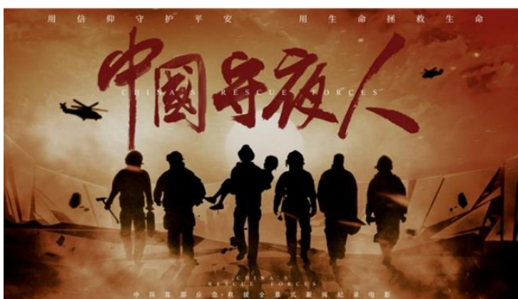
图 6: 《中国守夜人》