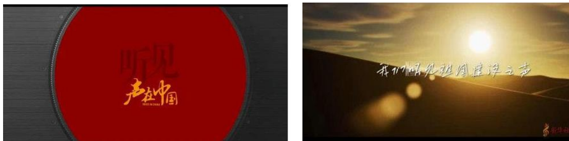
图 8：声在中国短片《听见》