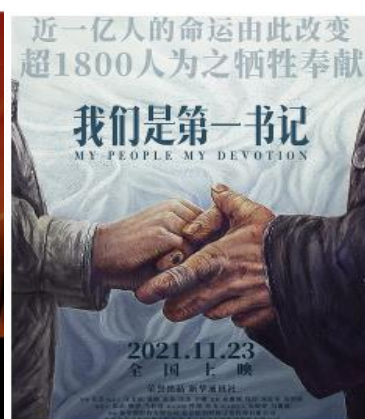
图 7: 《我们是第一书记》