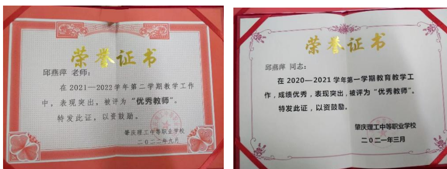
图 10 邱燕萍老师多次获得校内“优秀教师”光荣称号

邱燕萍，信息技术部美术组教研组长，从事设计多年。2018年开始从事美术设计教育至今，具有丰富的教学经验，性格温和，平易近人、热爱绘画。耐心引导学生，提升学习兴趣。肇庆市任重明名师工作室成员，多次获得校内“优秀教师”光荣称号，2022年广东省技能大赛教学能力比赛三等奖。2023年广东省技能大赛教学能力比赛二等奖。教学感言：教育的成功并不是仅仅在于培养最优秀的人，还在于培养天天有进步的人。