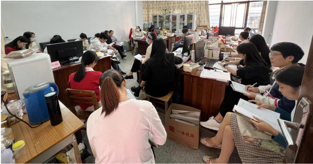
图 7-8 部分公共基础课、专业课教师参与公开课研讨