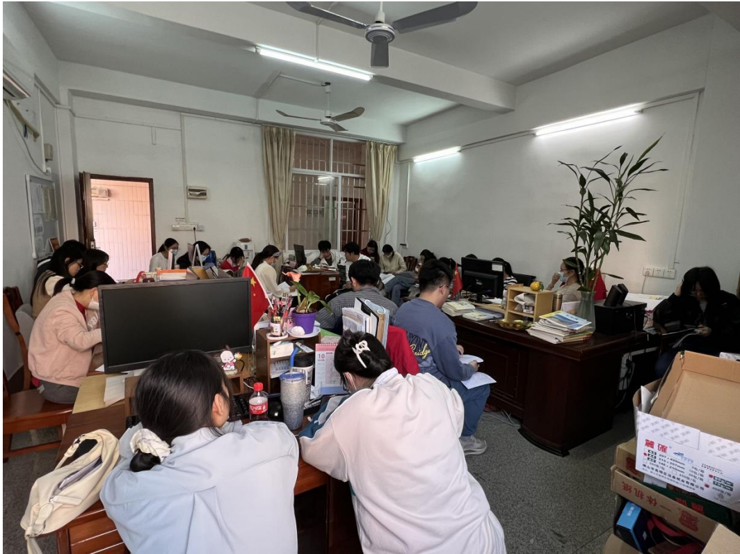
图 3：专业课教师参与公开课研讨