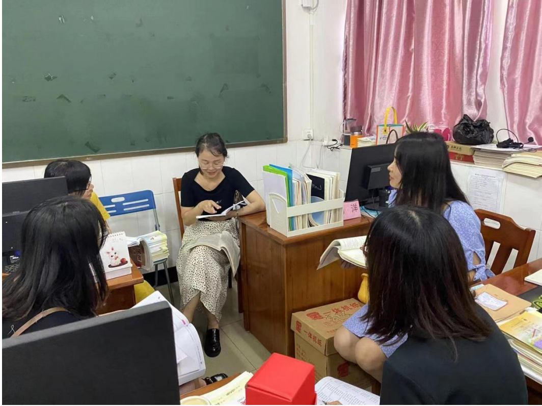
图 14：部分基础课和专业课教师一起研讨