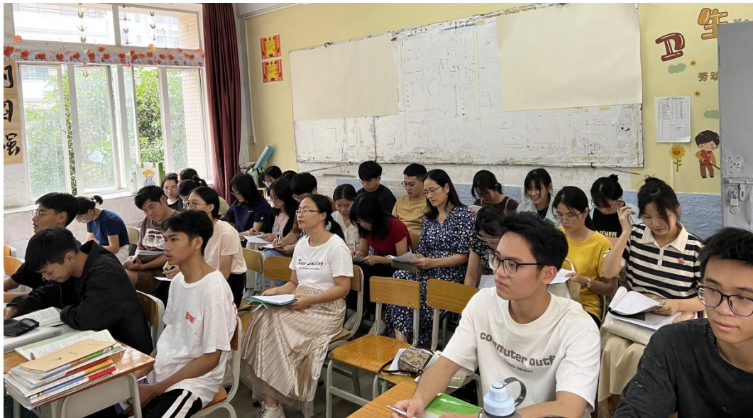
图 2：专业课教师参与公开课听课