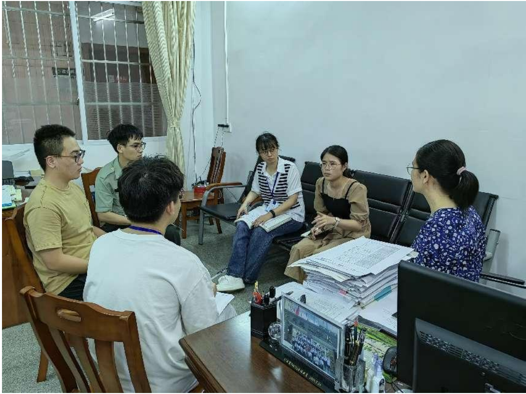
图 16：部分基础课和专业课教师一起研讨