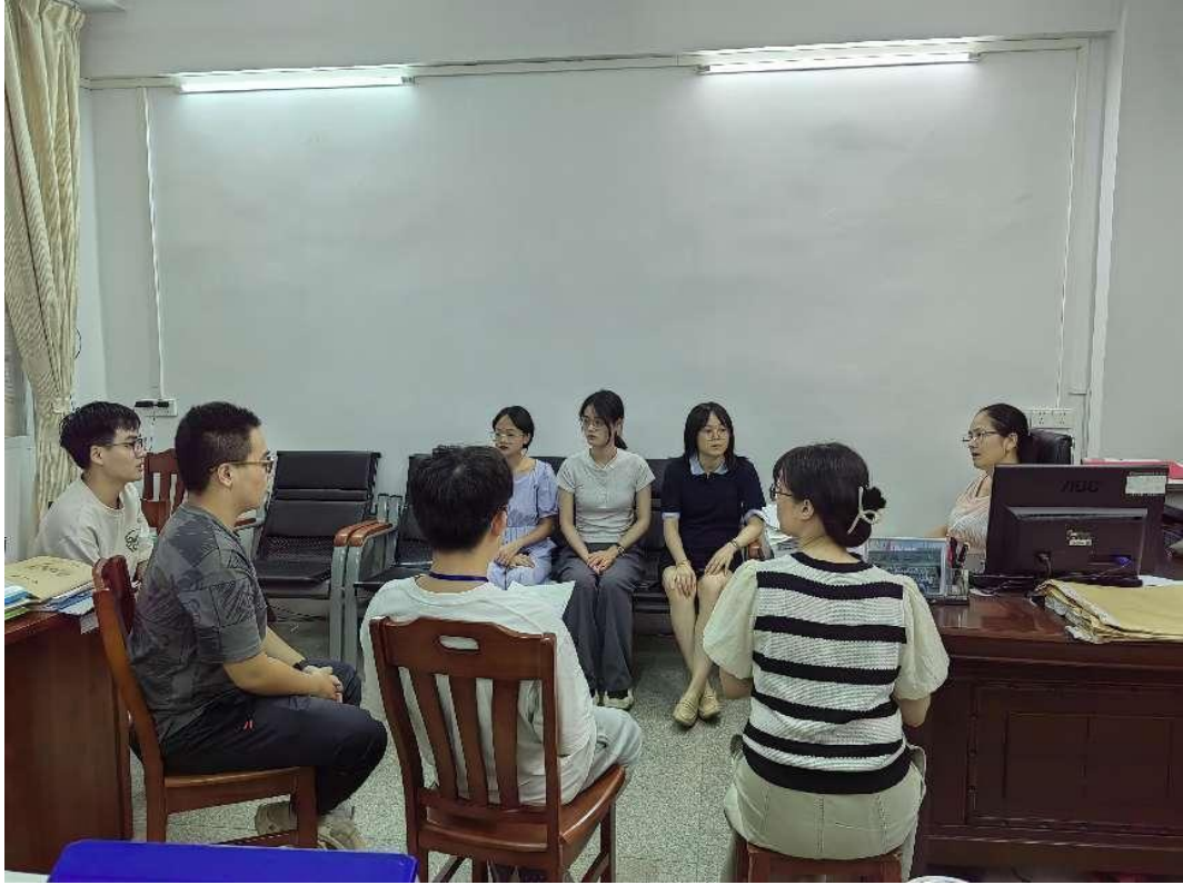
图 15：部分基础课和专业课教师一起研讨